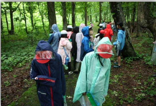
主体的な森林体験

このように、子どもたちはプログラムを重ねるうちに、目の輝きが増し、自信をつけていく様子が見え、本当に頼もしかったです。