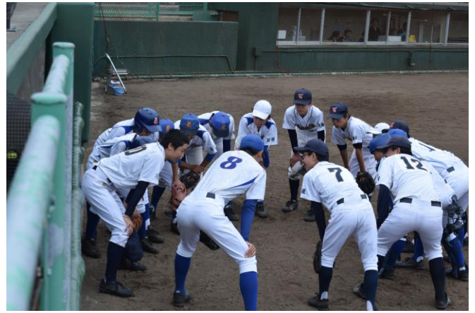
中体連野球(石狩市)