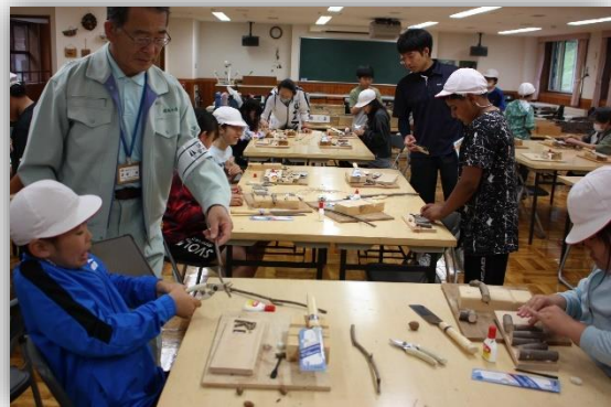
工夫いっぱいの表札作り