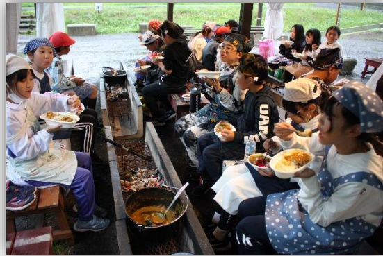
カレーは55合が一気になくなりました！