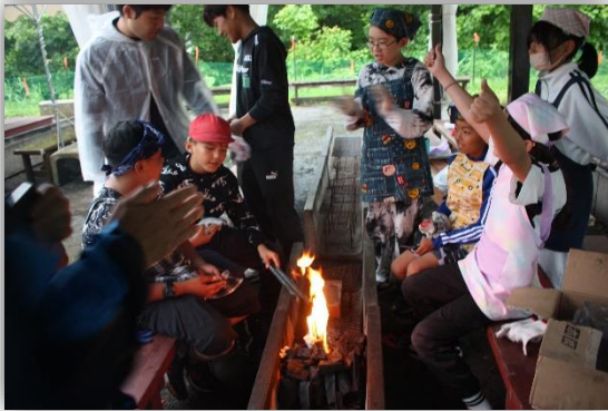
火おこしも自分たちで