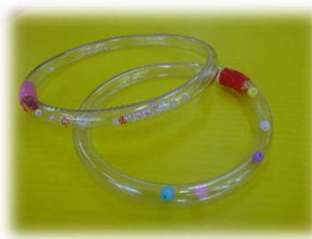
透明ホースマラカス