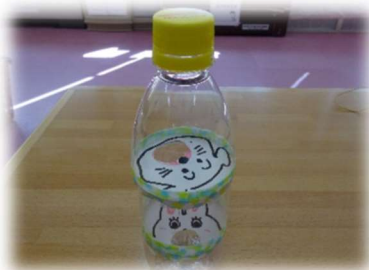
ビー玉コロコロ落とし