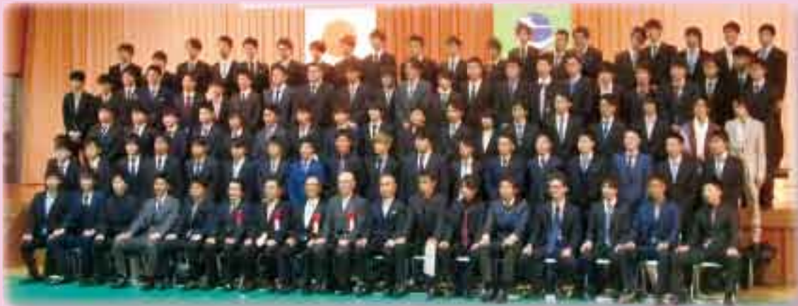
新成人集合 (当別町成人式 1月10日)