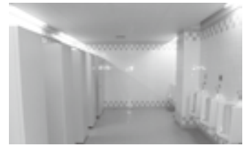
総合体育館トイレの洋式化に向けた動きは

町長 道では国の補助を受けて一定の所得を超えない夫婦を対象に1回あたり15万円まで、1年目は3回、それ以降は年に2回、通算で5年間