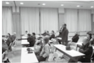
西当別コミセン会場