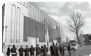
体育館南側壁面に設置した太陽光ソーラーパネル