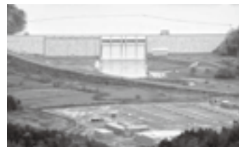
当別ダムと浄水場