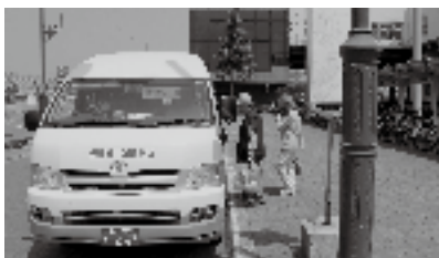
当別駅前から発車する当江線

町長 本路線バスは当別町と江別市を結ぶ交通として現在有限会社下段モーターズが運行しており、大きく赤字を抱える路線であることから、町と江別市と北海道がそれぞれ赤字補填として補助金を出して運営しているものである。平成17年度をもって、それまで本路線を運行していた民間事業者が路線を廃止することに