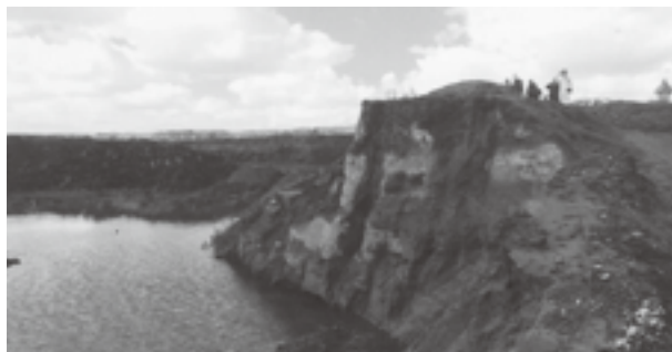
崖状になっている当別川 (右上は視察した土木現業所、町など関係者)