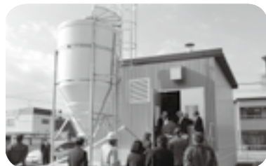
木質ペレットを貯めるサイロ