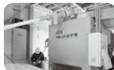
木質ペレットボイラー