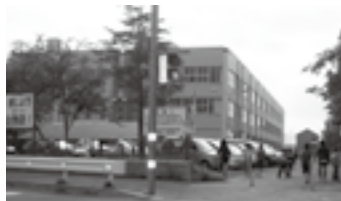
教員の事務負担軽減は

教育長 学校事務の円滑な実施と教員の事務負担軽減を目的に町独自の予算により事務嘱託員5人を雇用し、各小中学校に配置しているところである。引き続きこのような支援を続けていく。