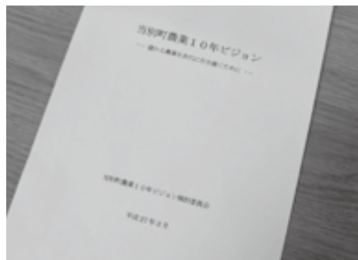
平成27年3月に策定した当別町農業10年ビジョン

町長 10年ビジョンの進捗状況について、11月2日に当別町農業10年ビジョン推進委員会を急遽開催し、10年ビジョンに掲げた目標を前倒して実現する決意を確認したところである。具体的にはGPS等を活用した総合的なスマート農業システムの構築、道の駅開設も見据えた野菜や花きの生産拡大と2次加工や企業誘致も見据えたブランドの確立、農作業受委託組織の設置やパート労働派遣体制の確立、輸出も含めた販路拡大等について、関係機関が連携し、優先的に取り進めていくことが確認されたので、今後早急に具体的な取り組みを進めていきたいと考えている。