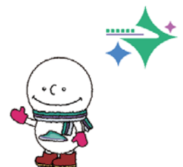
北海道新幹線開業PRキャラクター どこでもユキちゃん