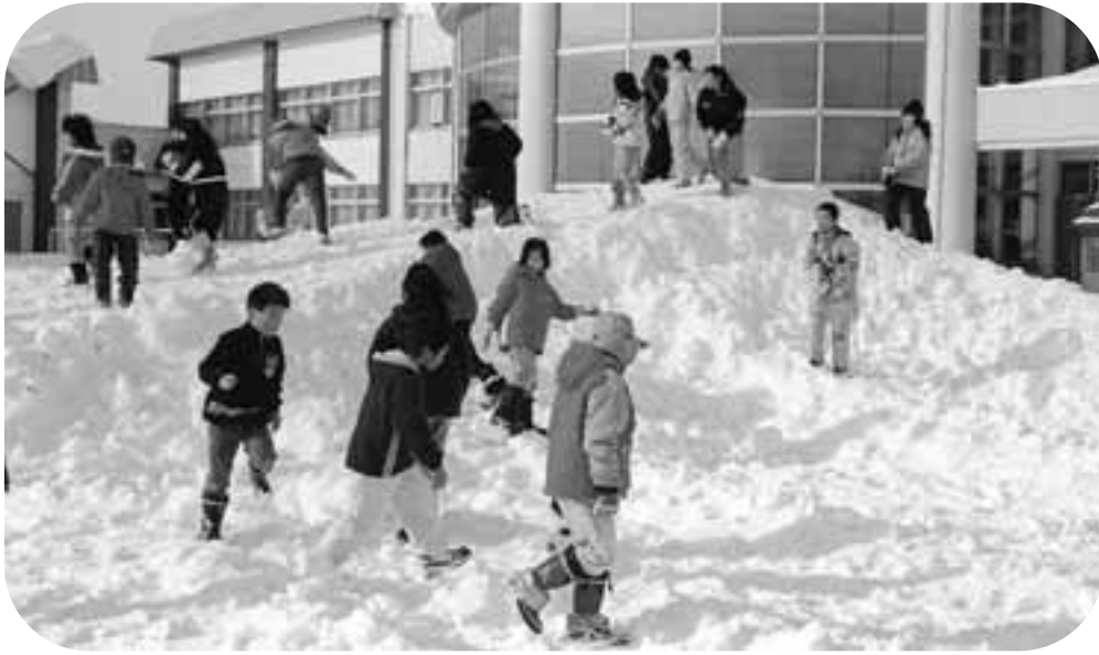
元気に遊ぶ子どもたち ～いじめ問題が各地で起きたが、楽しそうに遊ぶ子どもたちからそんな様子は見受けられないが～