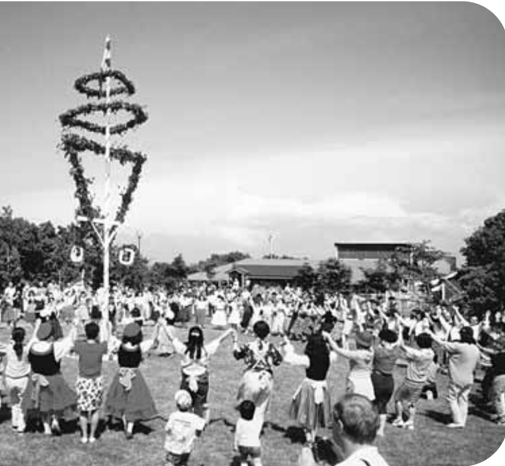
夏至祭のダンスは当別町の恒例行事です。 ～手を取り合い、心をつなぎ当別町の協働の考えとともに～

平成十八年第六回定例会は、十二月十二日～十四日までの三日間の日程で開催されました。 一般会計補正予算、下水道事業特別会計補正予算、水道事業会計補正予算、当別町副町長定数条例制定、地方自治法の一部を改正する法律の施行に伴う関係条例の整理に関する条例制定、当別町長期継続契約を締結することができる契約を定める条例制定、当別町印鑑登録及び証明に関する条例制定、当別町立へき地保育所条例の一部を改正する条例制定、当別町農業構造改善事業促進対策協議会に関する条例の廃止、北海道後期高齢者医療広域連合の設置、石狩教育研修センター組合規約の変更の協議、石狩西部広域水道企業団規約の変更の協議などを審議し、提案された議案すべてを原案のとおり可決しました。 七名の議員が一般質問をしました。