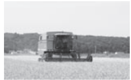
TPP協定による当別町の影響は

町長 民間企業、金融機関など多くの関係機関からのアプローチが来ている。これからは、農協、商工会、金融協会、町の4者で道の駅管理運営主体検討会を設立し、関係機関一体となって検討を進めていく。当別町が雪に悩まされている現状を訴え、人口減少対策として除排雪を充実させていくことを国にも訴えていくべきものと認識している。子育て支援策や定住促進策について、拡充した取り組みや先進的な取り組みをしてきているが、人口減少および少子化の傾向に歯止めをかけられていない。地方創生の主目的は、地方の人口減少、少子化対策であり、そのために生活環境だけではなく、経済の活性化と雇用対策も含めて総合的に取り組んでいかなければならない。