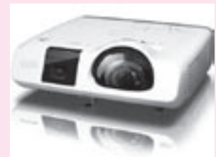
購入する電子黒板プロジェクター