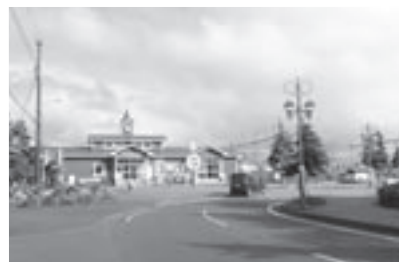
石狩太美駅前の道路

2年前より幹線、生活道路の区別なく除雪を行っていると聞いているが、道幅が狭くなっている上に、除雪が不十分なため、車が来ても避けるのに大変苦勞し、危険と毎年多くの声がある。人口減少にも着実につながる当別の最大と言っても過言ではない。除排雪問題は財政だけの問題なのか。町民の生活、命にも関わってくる重要な課題を町は全面的に責