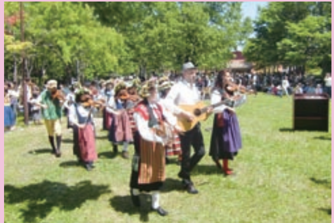
生演奏によるリースの行進