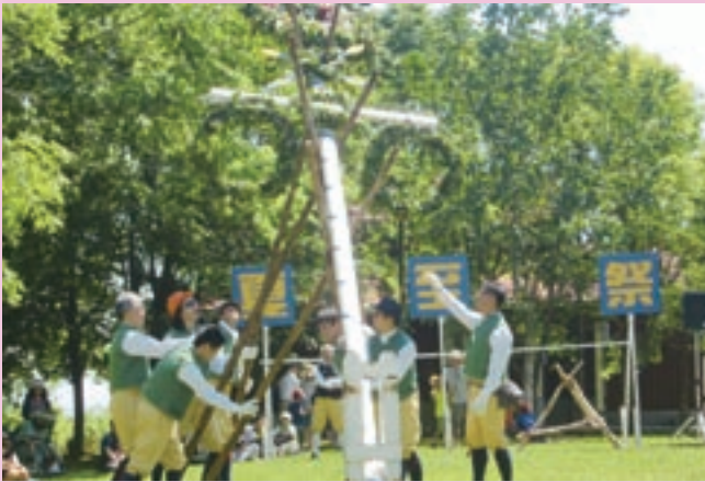
掛け声とともにマイストングの立ち上げ