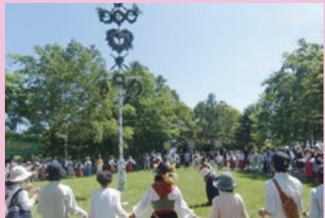
マイストングを中心に参加者でフォークダンス