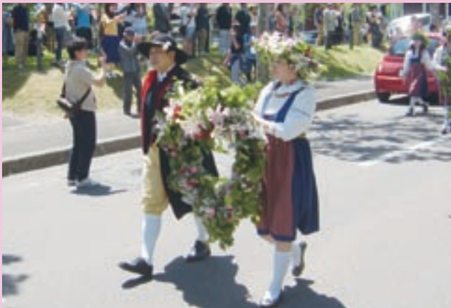
ハートの形をしたリースを手に新婚夫婦が行進の先頭