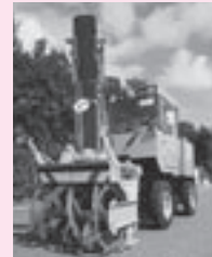
購入するロータリ除雪車と同型車