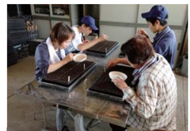
7 月 15 日実施 花の種まき講習