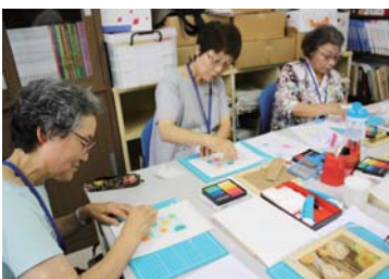
9 月 8 日実施 パステルアートを楽しもう

教育委員会が主催する秋の読書週間イベント「パステルアート体験教室」「竹とんぼ&マイ箸づくり教室」などで受講者と子どもたちの交流を図ります。