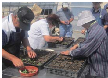
8 月 26 日実施 苗の植え替え講習