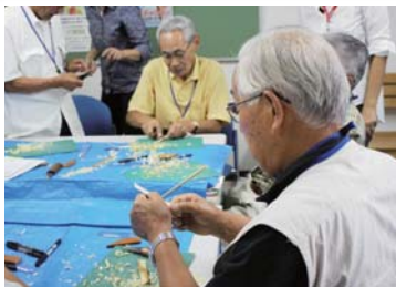
8 月 25 日実施 竹とんぼとマイ箸をつくろう