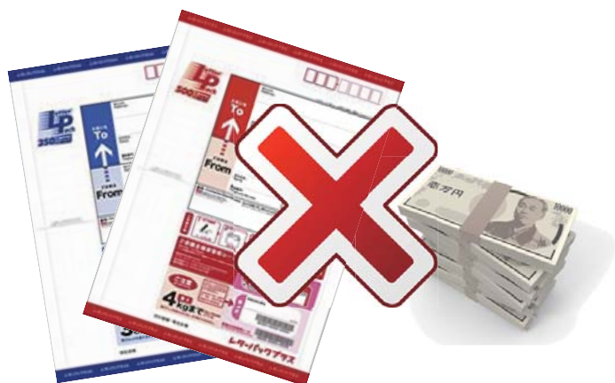
レターパックや宅急便で現金を送付することはできません。

また、公的機関を装い「個人情報が出てきているので削除する必要があります」と電話してくる場合も詐欺と考え、そのような電話があった場合は、すぐに電話を切りましょう。