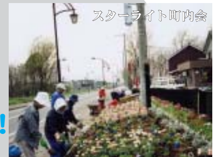
スターライト町内会