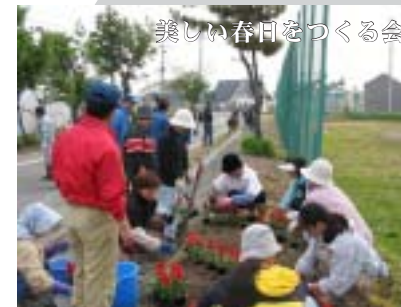
美しい春日をつくる会