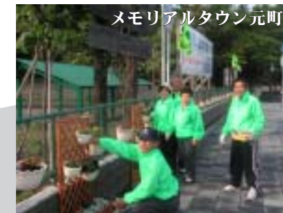
メモリアルタウン元町