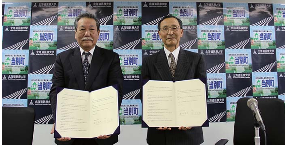
北海道医療大学と当別町との包括連携協定 (平成 25 年 11 月 8 日)