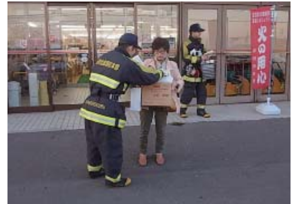
秋の火災予防運動も実施されました