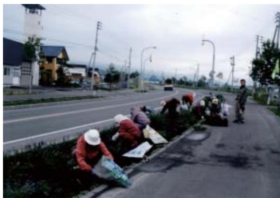
みどり野の会高齢者クラブ