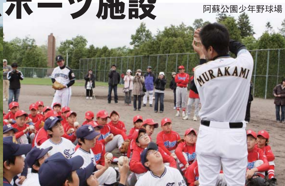
阿蘇公園少年野球場

町内の屋外スポーツ・プール施設がオープンします。楽しく、健康的に利用しましょう。