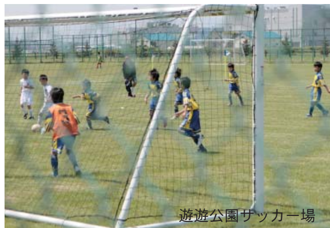
遊遊公園サッカー場