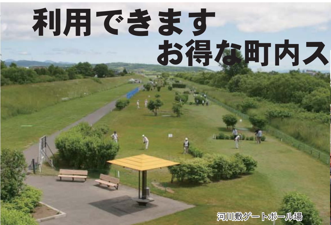
河川敷ゲートボール場