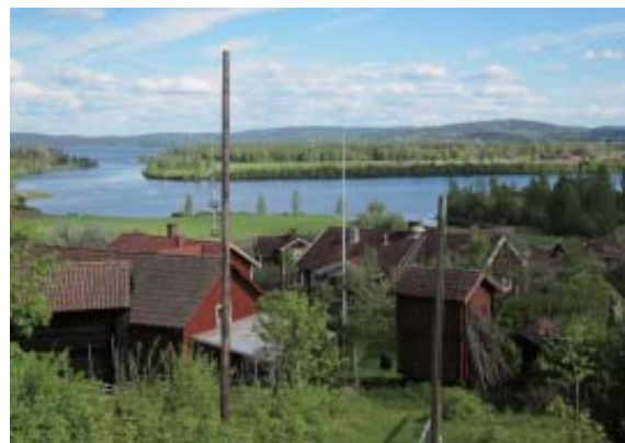
スウェーデン ダーラナ地方