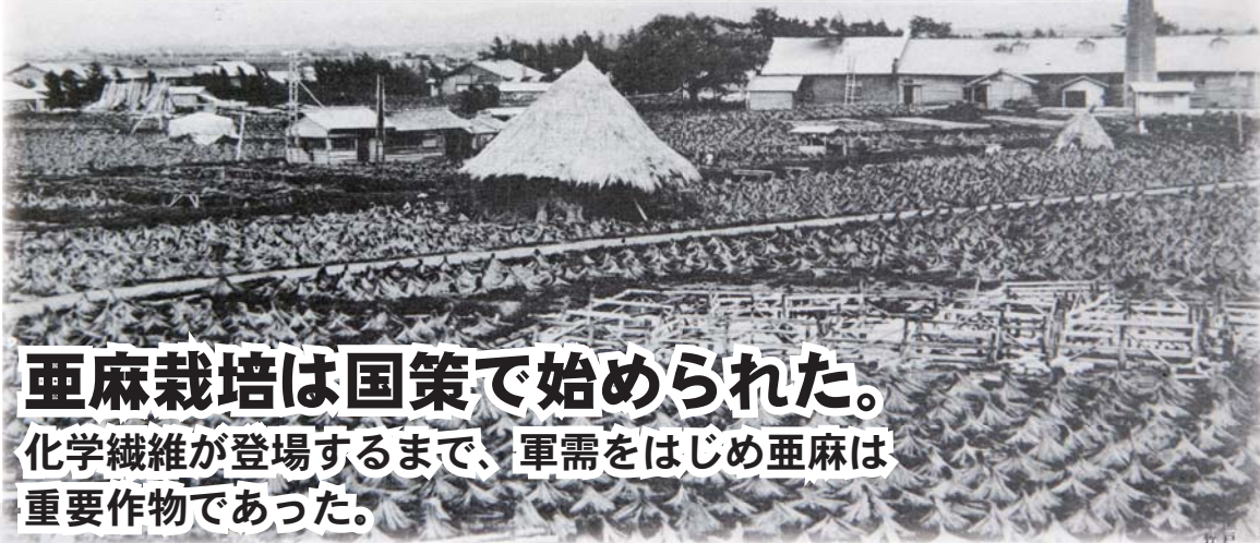
六軒町に開設された製線工場全景 右手煙突の建物が工場でその左端の建物が現存する機関庫 (写真：百年の歩みから 大正13年8月)

一面に唐傘状に置かれた亜麻は前年収穫したもので、池に2週間程度沈めた後、乾燥させている。このあと工場の機械で茎と皮に分離される。