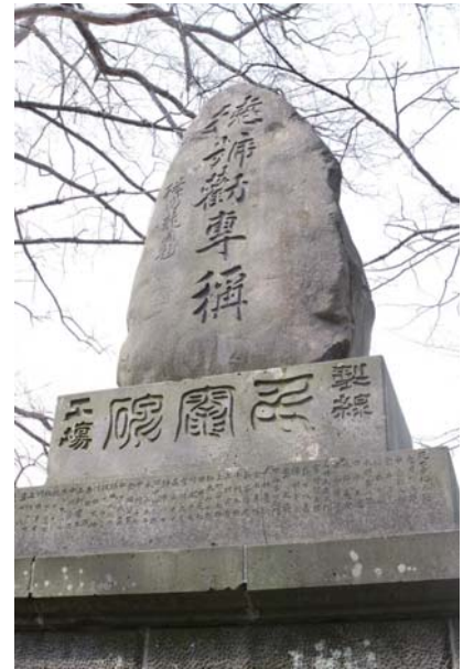
大成寺境内に残る製線工場慰霊碑（大正3年7月建立）には劣悪な労働条件のため、結核などで命をおとした44名の名前が刻まれています。