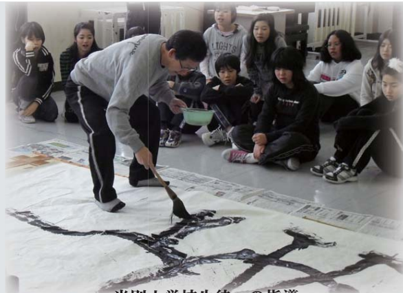
当別小学校生徒への指導