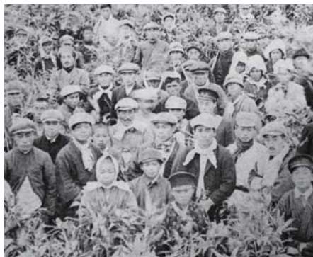
会社従業員の様子 記録では100人ほどの従業員の内、女性もほぼ半数を占めていたという。若い人が多く家族も写っていると思われる。

亜麻は連作障害があるため、同じ場所で続けて栽培できず、そのことから亜麻畑はどんどん広がっていきました。7月に収穫した亜麻は長さをそろえ25kgの大きさに束ねて出荷されました。会社はこれを買入れ、倉庫に保管した後、翌年春、水温の上がった時期に池に漬けて腐らせました。茎と皮をはがれ易くするために、1～2週間すると臭気を帯びた亜麻を池から引き上げ、唐笠状に拡げて乾燥させました。そのあと一時倉庫に保管し、随時工場へ持ち込んで茎と皮に分離させました。