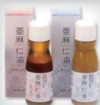
亜麻からできた製品

です。経営面から見ると決して楽ではない亜麻ですが、花を見て分るとおり魅力のある作物です。昔、当別は亜麻で潤ったと聞きましたが、今、また町を賑わせる花に育てたいです。若い生産者を中心に、大規模ではなくても少しずつ亜麻の作付けを増やし、亜麻の見られる町と言われるよう頑張っていきたいです。