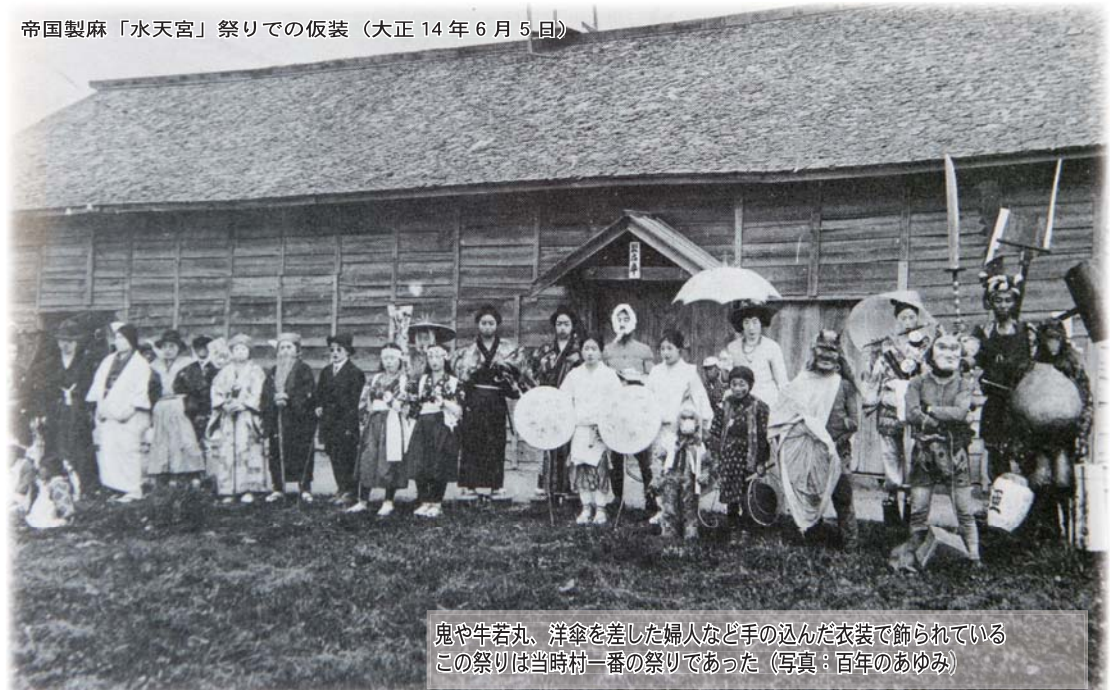
鬼や牛若丸、洋傘を差した婦人など手の込んだ衣装で飾られているこの祭りは当時村一番の祭りであった(写真:百年のあゆみ)