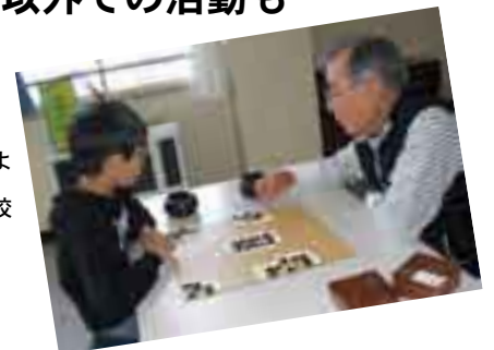
日本棋院当別支部による 囲碁教室（当別小学校 わくわくキッズ）