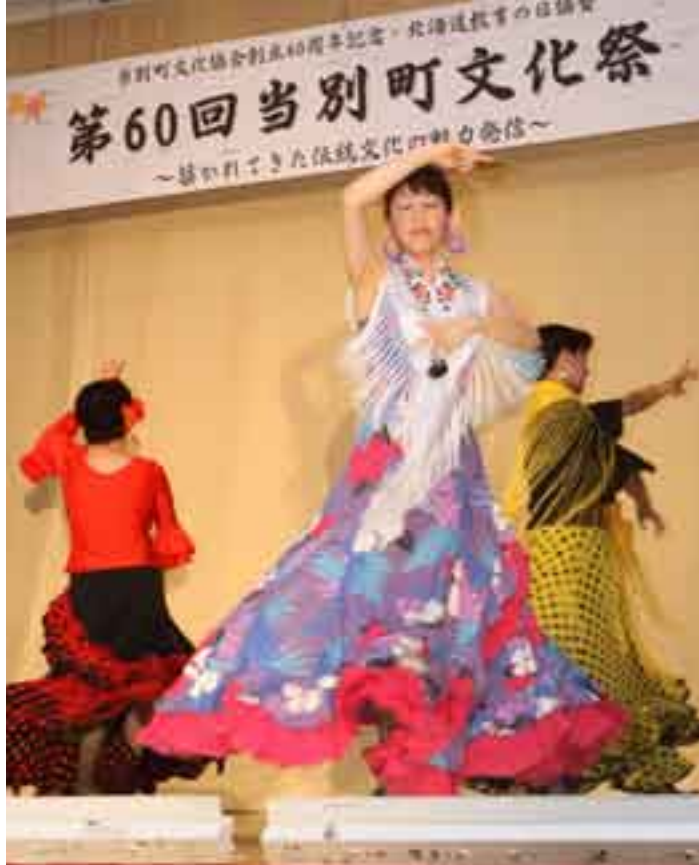
今年の文化祭発表部門