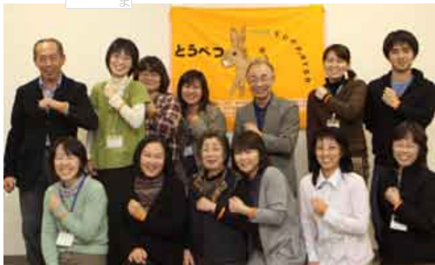
左手首に着けているオレンジリングは仲間（サポーター）の印です。