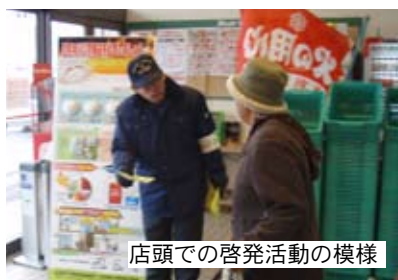
店頭での啓発活動の様相

当別消防署では、町民の防火・防災意識を更に高めるため、年末火災予防特別警戒期間中にラルズストアとフレッティーで、住宅用火災警報器の実物を展示し、住宅用火災警報器の早期設置と火災予防を呼びかけました。