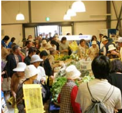
大勢の来場者で賑わったグランドオープン

飲食コーナー「TOMOTO」も同日にオープン。当別の食材をたっぷり使った特製カレーやオムライスなどのメニューが人気を集めていました。