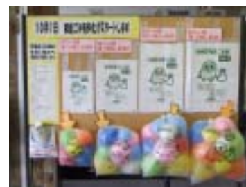
指定ごみ袋は10～40ℓまでの4種類です。

今月号では、1カ月後に迫ったごみ有料化の注意点をお知らせしますので、皆様のご協力をお願いします。