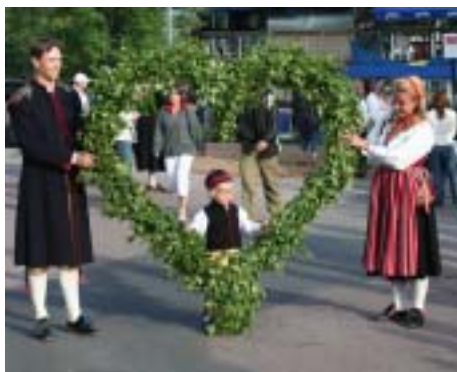
レクサンドの夏至祭の様（6月）

交流のきっかけは、元スウェーデン大使の「当別とストックホルム郊外の風景が似ている」との一言。