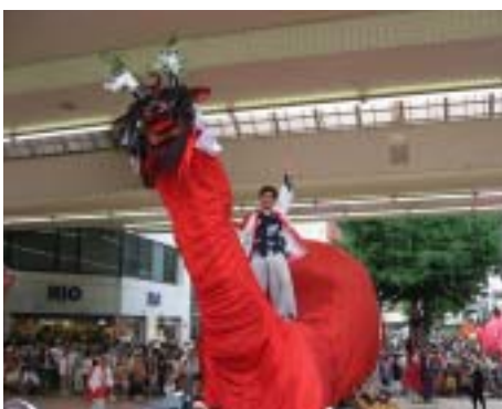
牛鬼祭りは夏の風物詩（7月）

伊達政宗の長男が宇和島藩の、四男が岩出山藩の初代当主であった縁から、1999年に岩出山町と宇和島市が姉妹都市提携しており、その縁で当別との交流が始まりました。