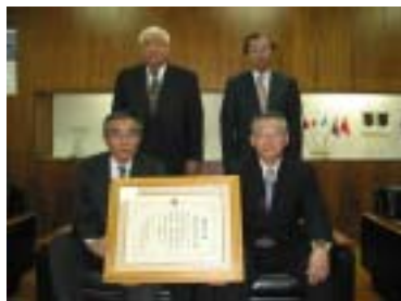
町選挙管理委員会委員のみなさん