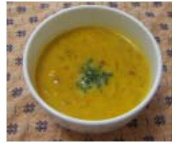
～かぼちゃのポタージュ～

寒い季節になってきました が、皆さんは風邪などひいてい ませんか？今回は、町内でもた くさん収穫される「かぼちゃ」 を使った料理を紹介します。