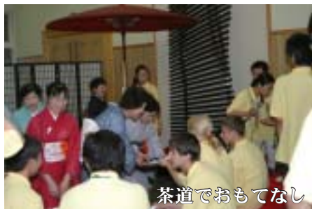
茶道でおもてなし