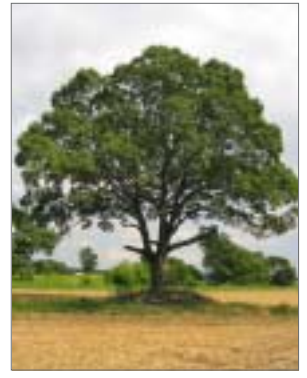
岸本辰彦さん (ピトエ)

湿原や沼沢地に生育する高木で、日本全国に分布している。湿原などに森林を形成する数少ない樹木。