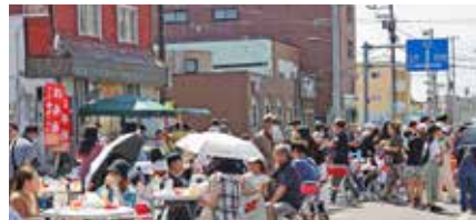
第4回とうべつ商工会祭りの様子(2023年)