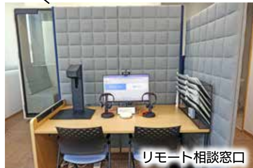
リモート相談窓口