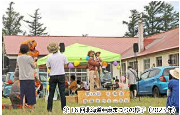
第16回北海道亜麻まつりの様子(2023年)