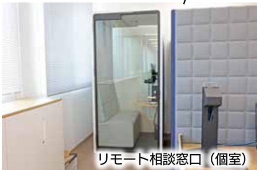
リモート相談窓口 (個室)