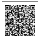
乳幼児健診 各種事業