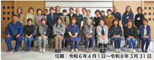
任期：令和6年4月1日～令和8年3月31日