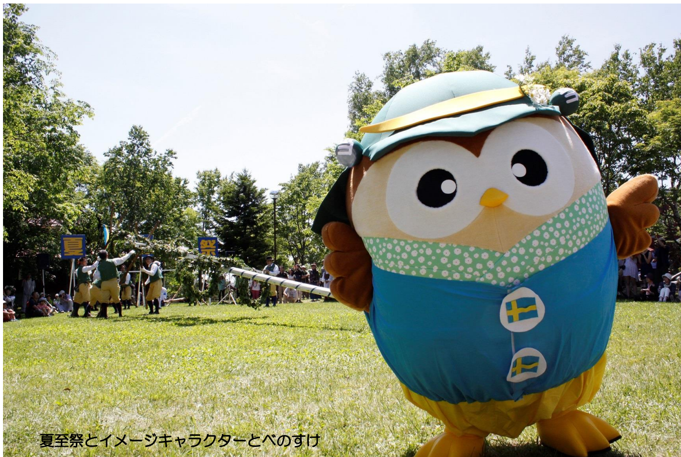
夏至祭とイメージキャラクターとべのすけ