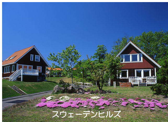
スウェーデンヒルズ