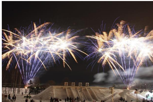
あそ雪のひろばの花火（2月）