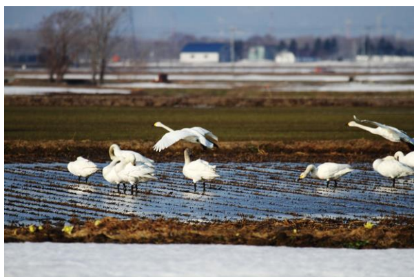
コハクチョウの飛来（4月）