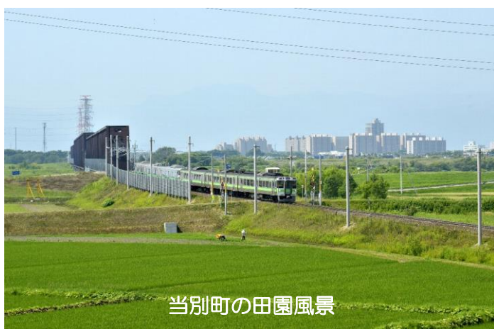
当別町の田園風景