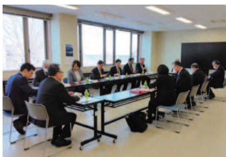
研修の様子（森町議会）

森町では、平成31年の選挙が無投票になったことを受け、定数と報酬について議論を重ね、令和5年の改選から定数を2名減の14名としましたが、報酬は現状のまま据え置きとしました。