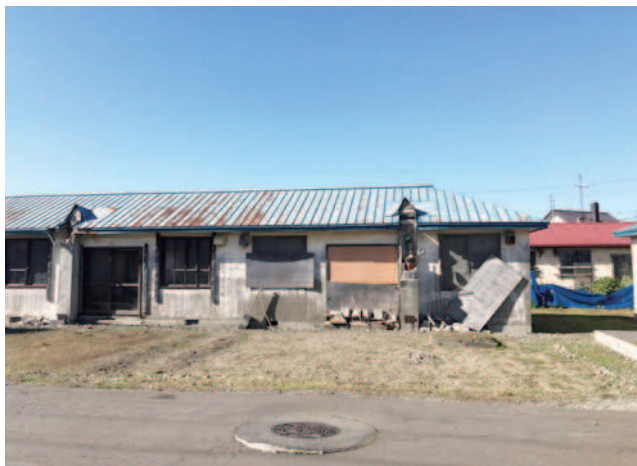
末広団地

まることなく、近隣自治体の政策を見据え、当別町の政策の優位性をより高めていくべきである。