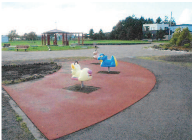
令和5年に整備された遊具（遊遊公園）

答 年齢は達しているが、障がいがあっても言葉を発せないなど、個々の状況によって違いはあると思われるが、基本的には、できるだけ意見を聞かせてもらうように考えたい。