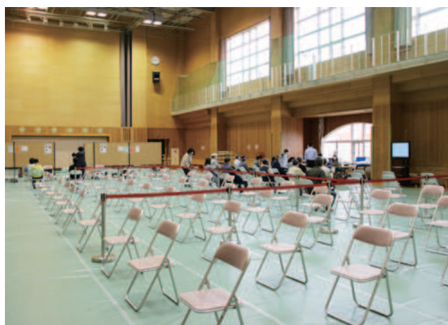
過去のワクチン接種会場（西当別コミュニティセンター）

新型コロナウイルスワクチンは、予防接種法上、季節性インフルエンザと同等に位置づけられていることから、無料での接種については考えていない。