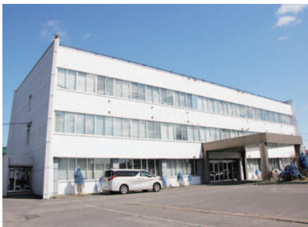
現在の当別町役場

答 遊具に関しては、多様なニーズを尊重して、誰もが安心して集えるような公園整備を進めていく。防災公園に関しては、地域防災計画と整合性を図り、有効性等を考慮して検討していく。