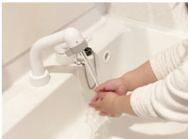
水道で手を洗う様子

答 影響は想定しているが、水道を使う人数や水量は把握しておらず、大学は特定の法人のため具体的な数字は示せない。水道事業経営戦略の改定の中で、料金の在り方の検討していく必要がある。