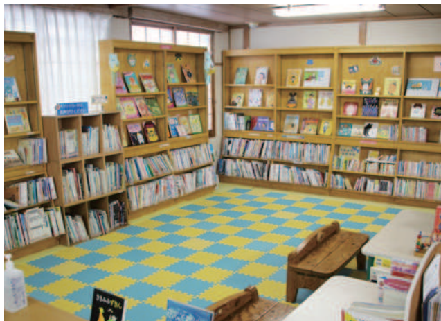
当別町図書館「ひくろう図書館」内部

答 本町における養育費立替制度の導入については、今後の国の政策動向や予算を注視し、本町の子ども政策の優先順位を見定めながら、総合的に判断していく必要があると考えている。