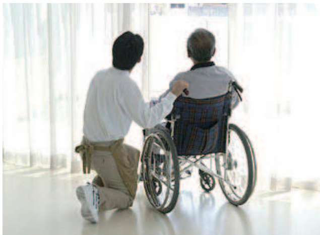
介護サービス（イメージ）

カーには、新型コロナワクチン接種を無料とすべきではないか。低所得者にはプレミアム付きクーポンを一律支給すべきではなかったのか。国民健康保険税の「保険料水準の統一」などについて質した。