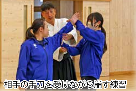
相手の手刃を受けながら崩す練習