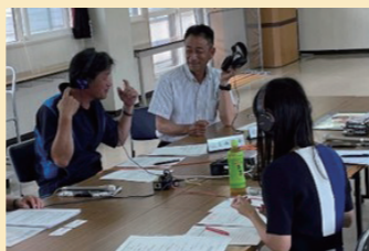
農業者年金をPRするラジオ番組に出演する秋吉会長と青山代理