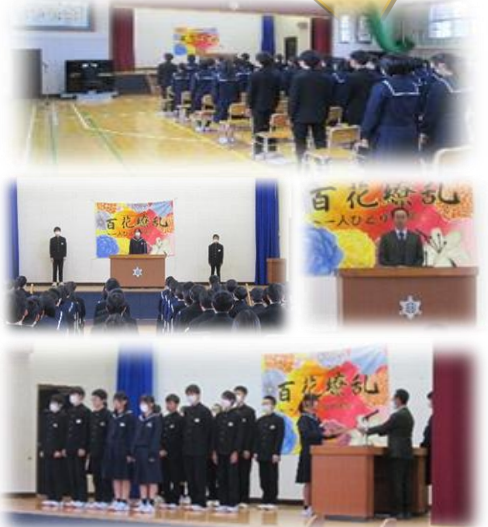
終業式の後に、各種表彰伝達が行われました

5校時に体育館で終業式を行いました。全校生徒で校歌を斉唱した後に、各学年の代表生徒のあいさつ、校長先生のお話がありました。終業式の後は、各種大会の表彰も行われました。6校時には各教室で通知表が配布され、半年間の