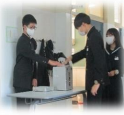
投票には、当別町選挙管理委員会から本物の投票箱を借用し、使わせていただきました