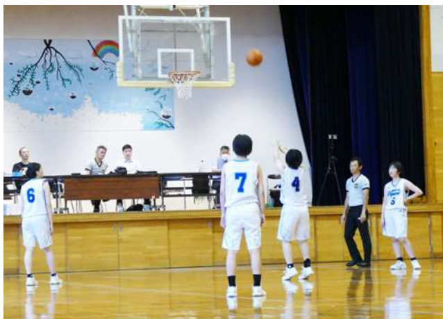
部活動の様子

答 ファミサポは共生型ボランティアのため、支援内容を膨らませると負担感が増え、協力者が減ることも考える必要がある。国の検討を注視しつつ、町全体の福祉として進めることが望ましい。