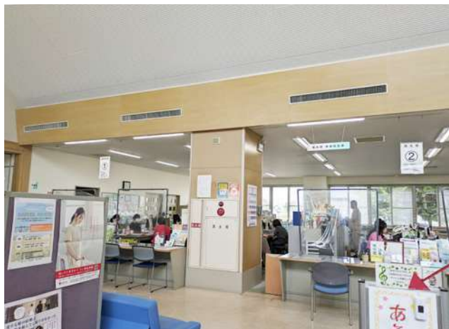
ゆとりの窓口

妊婦や新生児の家庭訪問などに利用者の声を聞いているが、今まで相談先が分かりづらいとの意見はなかった。今後も利用者が混乱しないよう分かりやすい窓口表示や事業周知に努めていく。