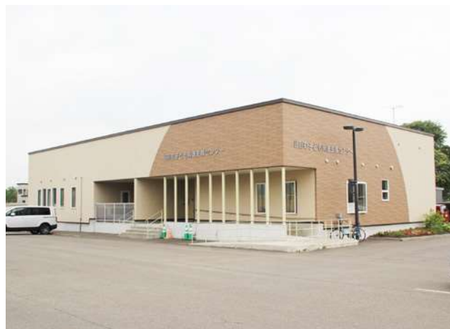
当別町子ども発達支援センター

答 教育と福祉の連携については、子ども発達支援センター、各学校、認定こども園、子育て支援センター等が意見交換する場を設け、各関係機関と連携して情報共有を図っている。