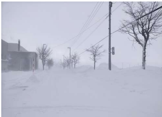
冬季のとうべつ学園付近の道路

答 さまざまな課題に対する保護者や児童の声を聞くことや意見交換の場に関しては、これまでもその都度対応してきている。これからも必要に応じて対応していく。