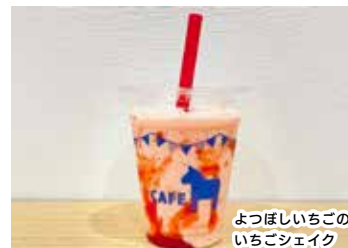
よつぼしいちご いちごシェイク

道の駅とうべつのお隣、to berry farm で愛情たっぷり育てられた甘い「よつぼ しいちご」を使用した特製シェイク。ミ ルクと甘さと、いちごの甘酸っぱさが口 の中を爽やかにしてくれます。