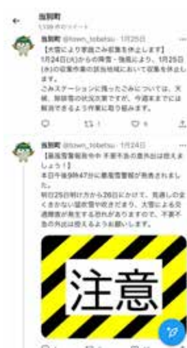
↑ 町公式 Twitter 画面