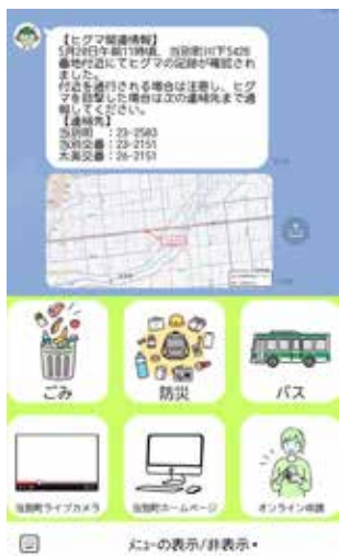
↑ 町公式 LINE 画面

アカウントをお持ちで登録がお済みでない方は、広報とうべつ裏表紙下部の QR コードからぜひ登録ください。