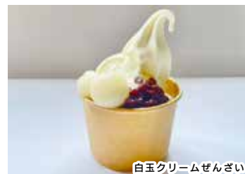
白玉クリームぜんざい

開業当初に限定販売していた幻のメ ニューが、皆さんからの熱い声援に応え て再販売となりました。