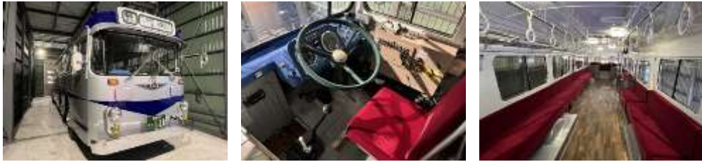
旭川電気軌道所有MR430のレストア車

・開催日:2023年7月16日(日) ・時 間:10:00~15:00 ・場所:JRロイズタウン駅前駐車場 ▶ MR430のレストア車(旭川電気軌道所有)の展示 車内で写真撮影、車両情報やレストアの映像を再生、模型販売、MR430カードをプレゼント ▶ 日本ハムファイターズ関連車両(北海道バス所有)の展示 EVバス、Fビレッジクルーザー、日本ハムファイターズチームバス