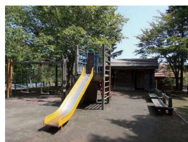
スウェーデン公園