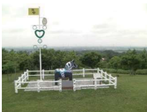
レクサンド記念公園