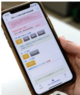
アプリで出欠を登録。

保護者は欠席の連絡や通園バスの利用をアプリで登録。欠席理由を細かく記載できるので、園児の体調把握にも役立ちます。