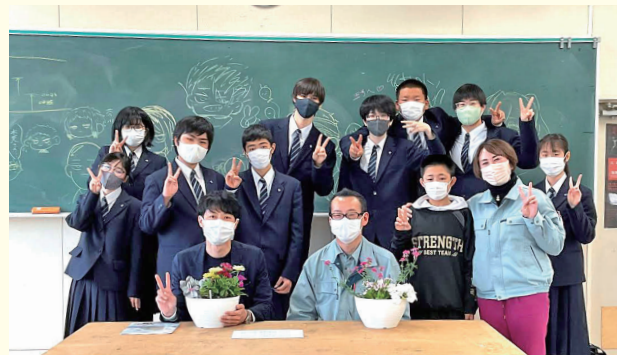
当別高校生と「CLASS プロジェクト」のワークショップ

ここに書ききれないエピソードや写真は当別町ホームページ「現在を生きる+」でご覧ください。