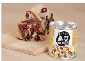
◆まぜるだけ黒豆ご飯のもと (黄色) SALE 期間: ~ 2/22 まで