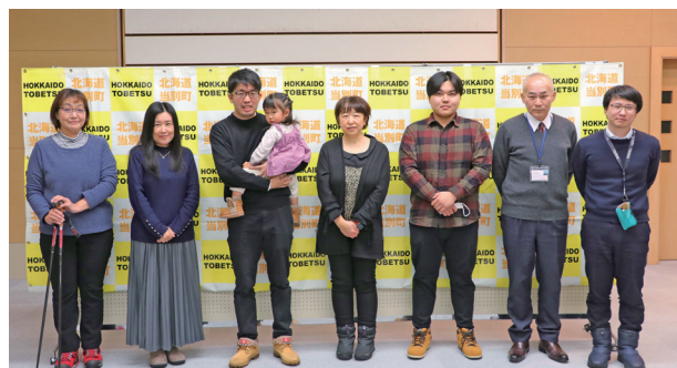
「測って100日チャレンジ」表彰式（12月19日撮影）

BMI（肥満度）とは… 体重 (kg) ÷ 身長 (m) ÷ 身長 (m) 25以上：肥満体型、24.9～18.5：標準、 18.4以下：やせ、22：理想体型