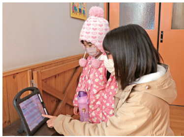
バスを利用しない保護者はタブレットで登園を記録。