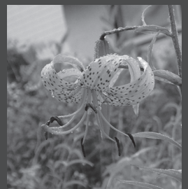
路傍に咲く品種名不詳のスイセン属(東裏) 昔ながらのオニユリ