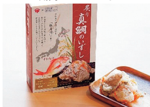
◆炙り真鯛のいずし SALE 期間: ~ 3/6 まで