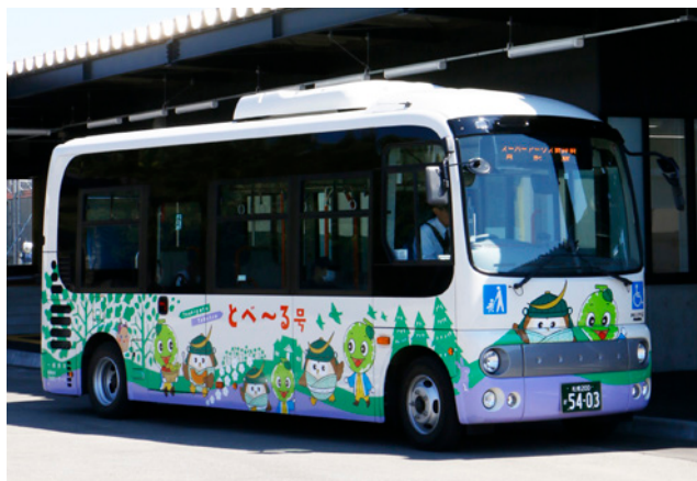
札沼線代替バス（とべ〜る号）

国からの補助金が増えたことと、2往復少ない土日祝日便の運行開始による人件費や燃料費の削減が主な原因。利用人数は、JR 廃線に伴い月形高校生の利用がなくなったことによるもの。