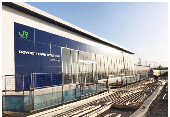
駅前整備が進むロイズタウン駅(当別太)

駅前広場の工事と同時で、年内に終わるよう進めている。また、通常、歩道は碎石を入れ、その上を舗装するが、そこを今回コンクリートに変えるため、通常より強度は高まる。