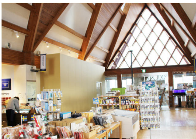
道の駅とうべつ コンビニ出店予定箇所