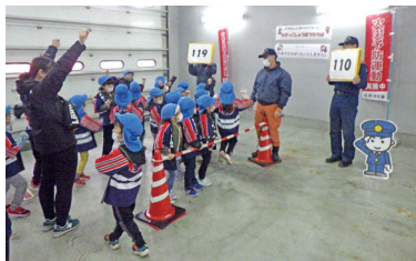
ちびっこ消防ひろば (おとぎのくに)

当別消防署は、10月15日から10月31日まで「秋の火災予防運動」を実施しました。期間中は「ちびっこ消防ひろば」や「防火教室」、「消防防災クイズ」などを実施し、町内の方々に防火意識を高めていただきました。これからの時期は暖房機器の使用が増え、空気も乾燥するため火災が発生し易くなります。