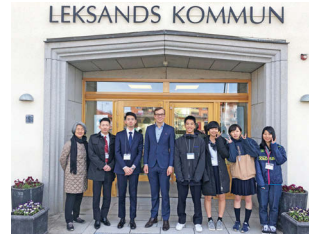
令和元年度実施の様子

人材育成基金を活用し実施している「高校生の短期留学海外姉妹都市ホームステイ研修事業」ですが、令和5年度の実施は受け入れ先であるスウェーデン王国レクスサンド市と令和5年秋頃の開催に向けて協議を行っています。詳細が決まり次第、改めて町広報誌・町ホームページでお知らせします。