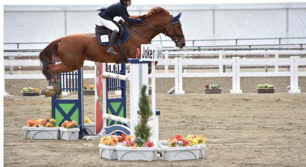
栃木国体トップスコアで高難度のジョーカー障害を飛越

ここに書ききれないエピソードや写真は 当別町ホームページ「現在を生きる+」 でご覧ください。