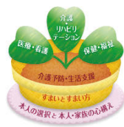
地域包括ケアシステムの5つの構成要素を示す植木鉢

住み慣れた地域や自宅でいつまでも安心して暮らしたいと願う方は多く、今後も高齢化が進み、様々なサポートを必要とする人が増えていく中、医療分野や介護分野の連携をはじめとした地域ぐるみのネットワークづくりが進んでいます。当別町も、住み慣れた地域で暮らし続けられるよう、医療・介護、予防、住まい、生活支援サービスを切れ目なく提供するための仕組みづくり＝当別町版地域包括ケアシステムを地域包括支援センターが中心に展開しています。