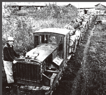
木材を運ぶ簡易軌道(『当別町史』より)

実働9年で消えた鉄路であったが、積雪や流入した土砂の除去、水害で破損した橋脚の修理など、軌道の保全には少ない人数ながら、「一日も早く奥地への開通をなすべく」関係者の並々ならぬ努力があった。こうした努力によって、一時期でも開拓民の夢と、地域の人々の日常生活が支えられたのである。