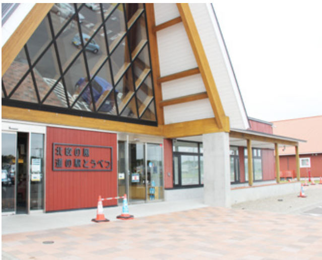
コンビニの出店予定箇所（写真右側）

ンビニの客層は異なると互いに認識した上で、コンビニ客をどう引き込むか連携していくと合意している。マイナスの影響が出ないように、(株)tobe中心に道の駅を運営していくとのこと。