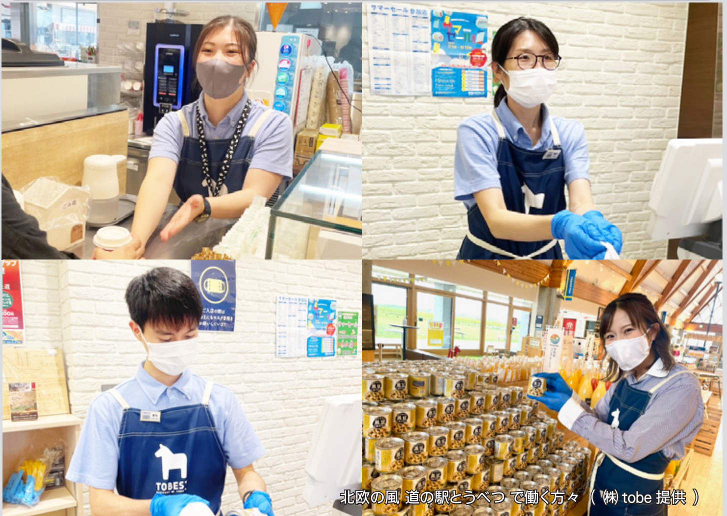
北欧の風 道の駅とうべつ で働く方々