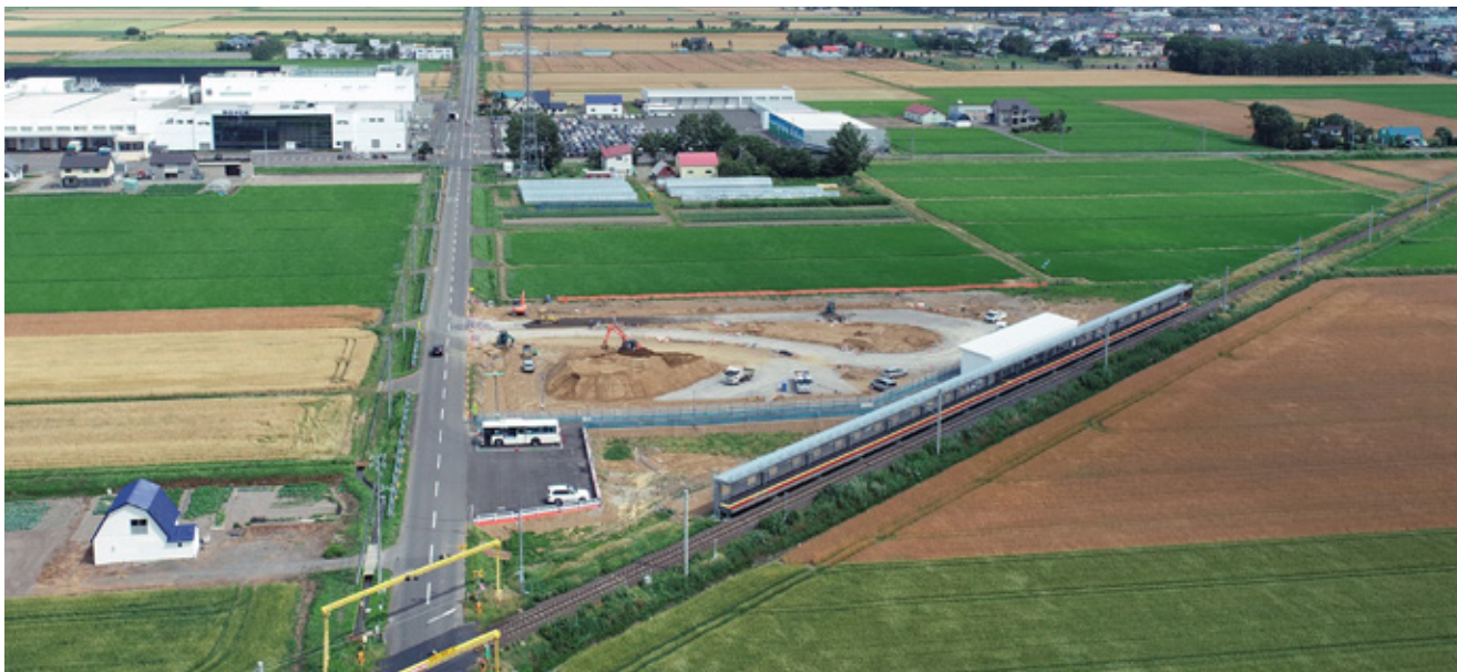
整備が進むロイズタウン駅前広場（当別太）