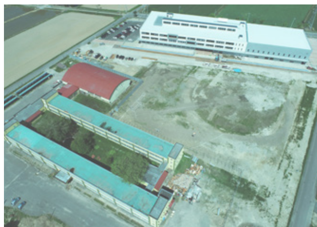
とうべつ学園グラウンド部分（下川町）

グラウンド全体 2万9,195㎡のうち1万5,050㎡、約51%が芝生になる予定である。校舎解体工事が令和5年1月31日、グラウンド整備が令和5年11月15日に完了する予定である。