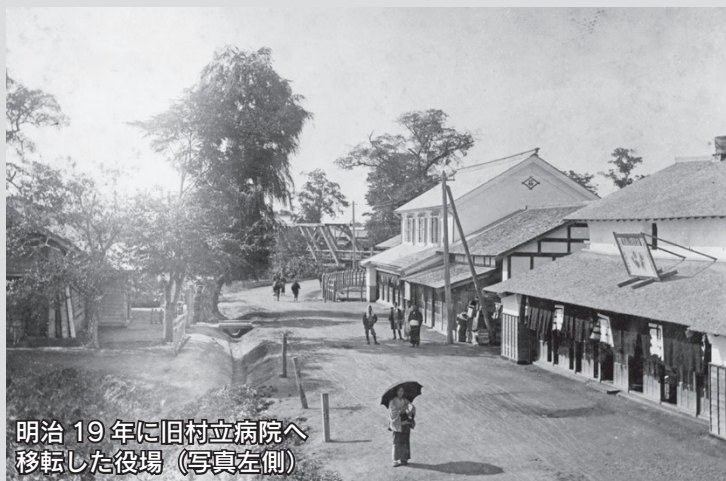
明治19年に旧村立病院へ移転した役場（写真左側）