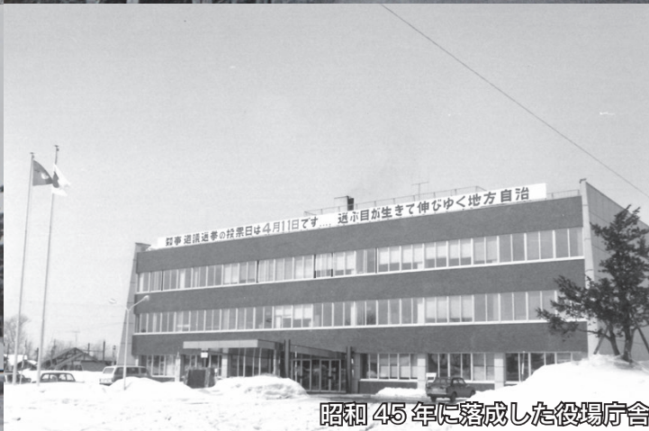
昭和45年に落成した役場庁舎