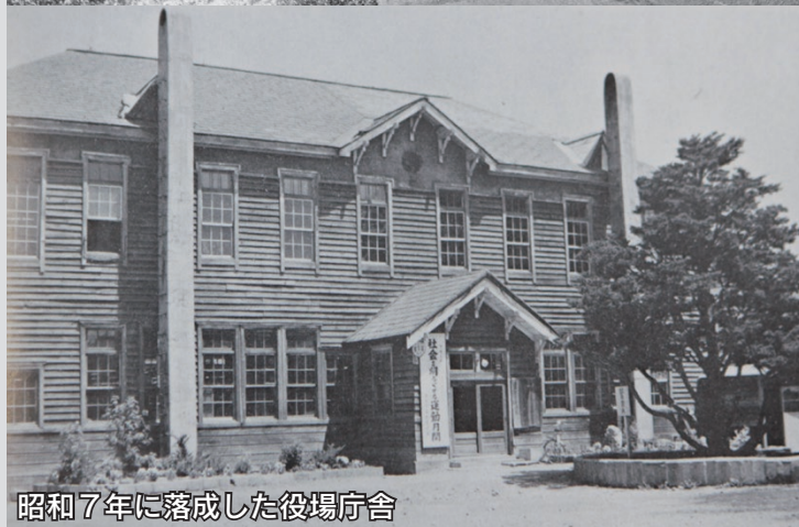
昭和7年に落成した役場庁舎