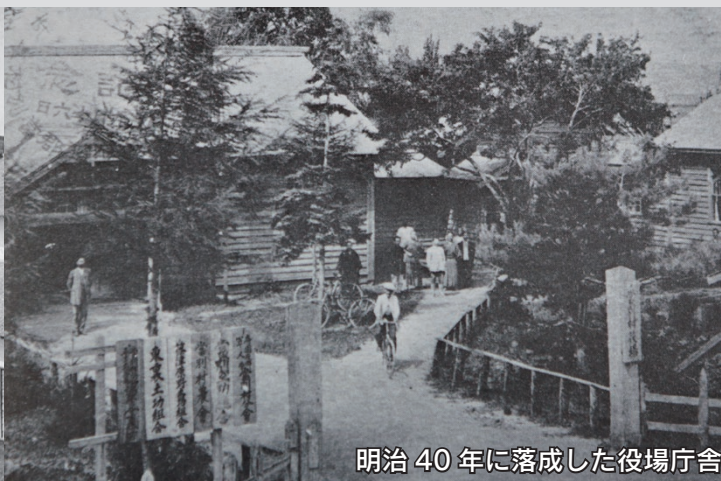
明治40年に落成した役場庁舎