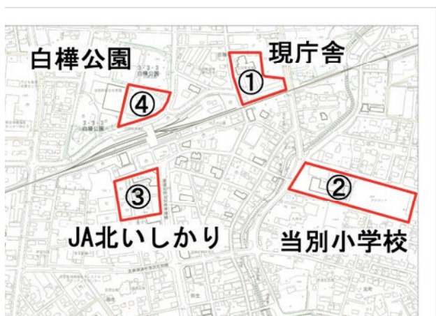
新庁舎建設候補地

問 新庁舎建設検討委員会は、どのようなメンバーで、どの部分について協議をする会議なのか。 答 メンバーは、庁舎を利活用する関係者や関係団体。例えば、まちづくり、子育て、福祉、防災などに関連する者が参加するイメージ。その他に公募も考えている。役割は、新庁舎の建設に関すること全般を審議していくこととしている。