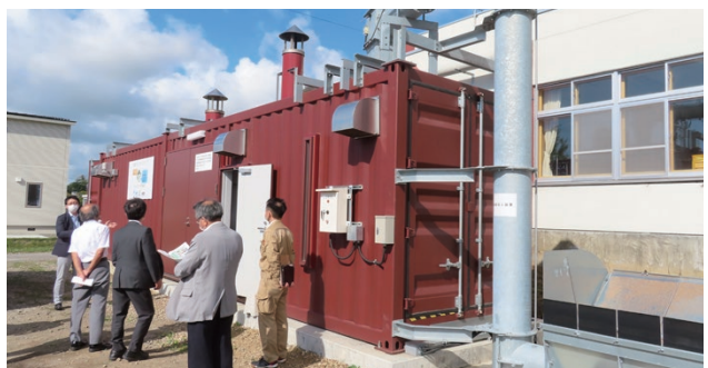
西当別小学校チップボイラ（太美町）