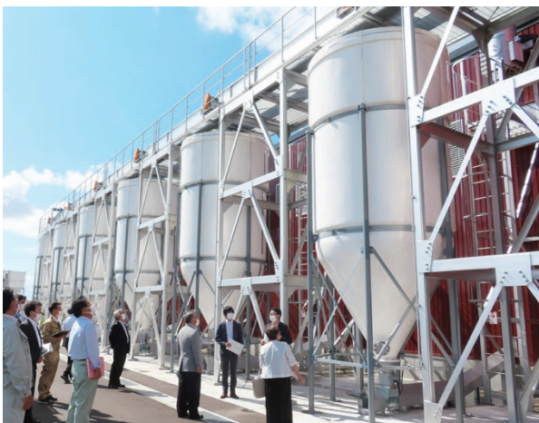
北海道バイオマスエネルギー発電所（樺戸町）

北海道バイオマスエネルギー発電所、水稲や大豆の生育状況、西当別小学校チップボイラなどを視察し、事業者や石狩農業改良普及センター、担当課から説明を受けました。