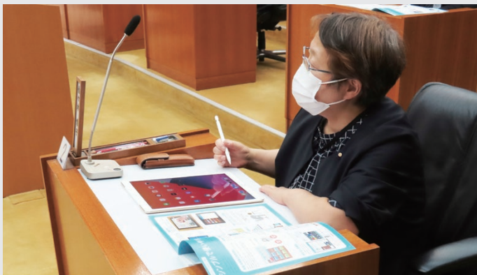
デモンストレーションの様子

当別町議会では、ICT化推進に向けてペーパーレスシステムの導入を検討しています。