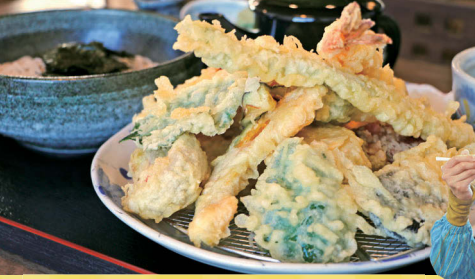
てんこ盛り天ざる