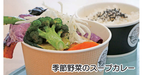
季節野菜のスープカレー