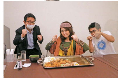
13 | 田西会館からの挑戦状!!