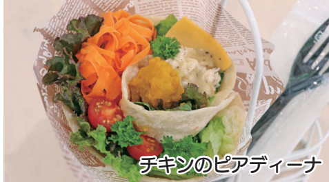
チキンのピアディーナ