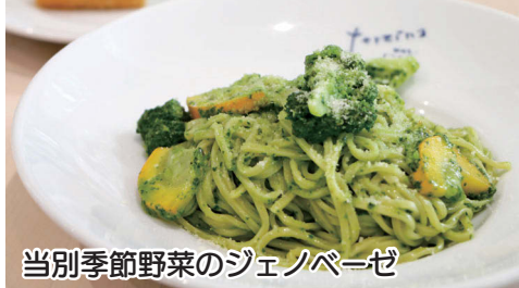
当別季節野菜のジェノパージェ