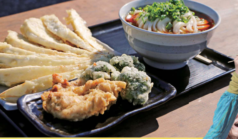
9 | かぼと製麺所