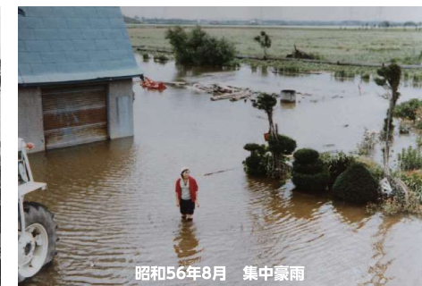
昭和56年8月 集中豪雨