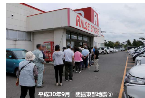
平成30年9月 胆振東部地震②