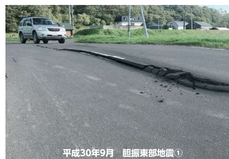
平成30年9月 胆振東部地震①