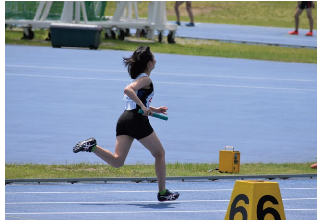
当別中学校陸上部

各中学校の校長と事前に協議を行い、可能性があるものとしては、野球部、バスケットボール部、陸上部(当別中学校のみ)ということで事前調整させてもらっている。