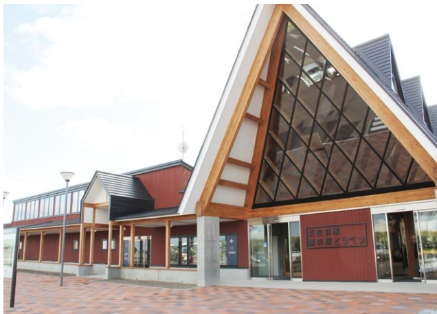
北欧の風 道の駅とうべつ

答 ロイズ工場、道の駅、ロイズタウン駅、太美駅の4拠点を結ぶ人の流れを作り出すことで、町の認知度が高まり、新施設での雇用も期待され、結果として、定住人口増加に繋がると考えている。