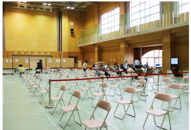
ワクチン接種会場（西当別コミュニティセンター）

先日、介護ヘルパー等の関係者も出席する民生委員の会議で説明させてもらい、そのような方がいた場合は伝えてもらったり、町が情報をもらいアクションを起こそうと考えている。