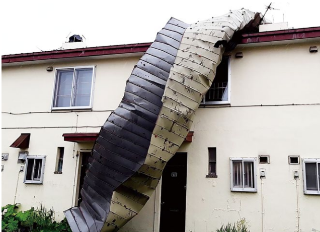
強風により剥がれた屋根(東町団地)

建設年度の新しい住宅や低層階への入居希望が多い状況。以前も答弁したが、建て替えに大きく方針転換する時期を迎えたと判断し、現在、計画の見直しを行っている。