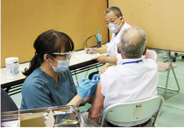
ワクチン接種の様子（西当別コミュニティセンター）

町で進めている新型コロナウイルスワクチン接種に関して、予約方法や接種券の内容、個別接種や集団接種の違い、かかりつけ医の定義、障がいのある方や高齢者の方への周知や配慮など、多岐にわたる質疑がありました。