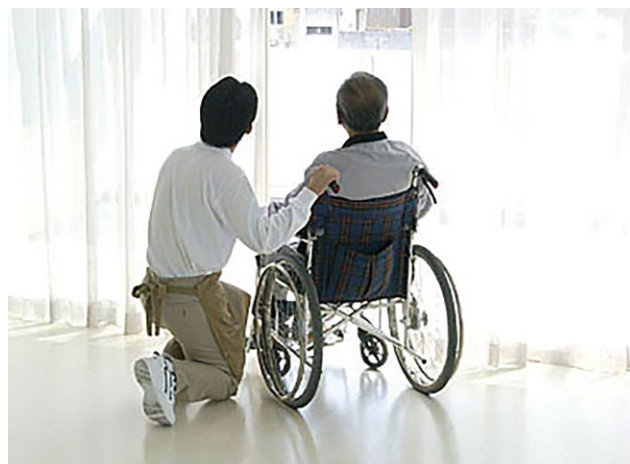
医療・介護施設への継続支援を

答 医療機関、高齢者施設等には、日々高い緊張感の中で尽力いただいている。当別町の場合、皆さんが非常に協力的で、犠牲を払ってまで対応いただいているため、継続支援すべきと考えている。