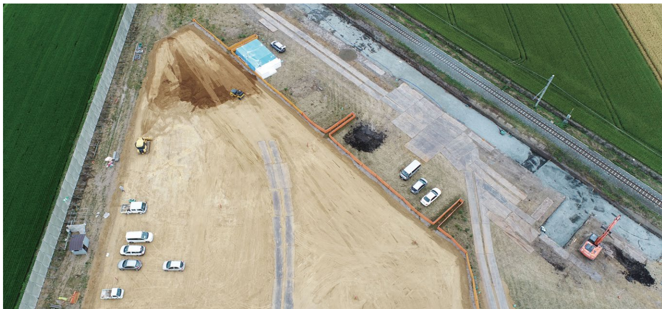
新駅建設現場上空