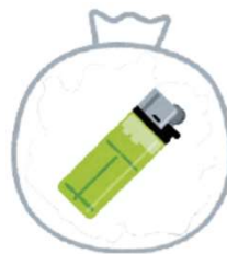
スプレー缶類 [ライター・ガスボンベ]（無料）