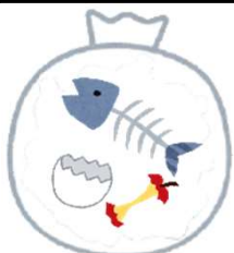
燃やせるごみ（有料）

燃やせるごみ（有料）と危険ごみ・スプレー缶類（無料）の収集日が同日となるため、それぞれ分けて出してください。