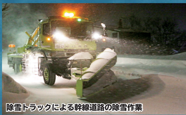
除雪トラックによる幹線道路の除雪作業