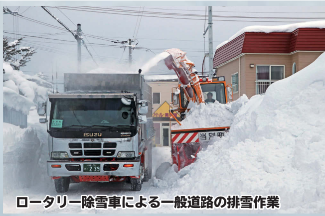
ロータリー除雪車による一般道路の排雪作業

排雪作業中は交通規制を行っており、場合によっては道路を迂回してもらうこともありますので、ご協力をお願いします。