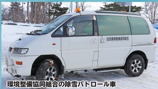
環境整備協同組合の除雪パトロール車

当別町内でも地域によって降雪量が違うため、パトロールでその日に除雪する道路を決めて、家で待機している除雪車の運転手に連絡して、除雪作業の準備に入ります。