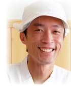
一久大福堂 店長 側さん おすすめ いちごかき氷

浅野農場自慢の SPF ポーク使用！ふつうのシュウマイより大きくて、お肉もたっぷり！ぜひ、味わって♪