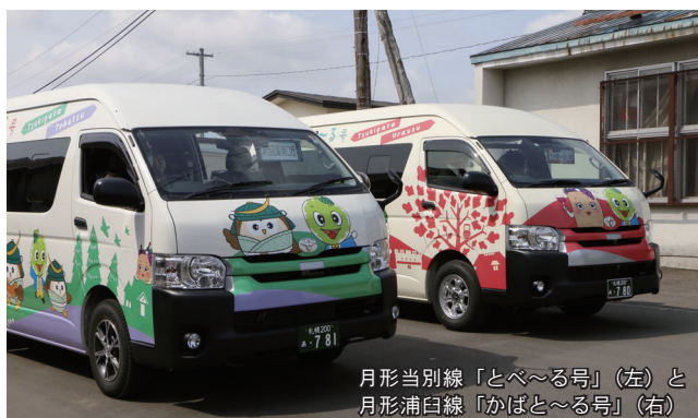
月形当別線「とべ〜る号」(左)と 月形浦臼線「かぼと〜る号」(右)

JR 札沼線・北海道医療大学駅以北の廃線に先立ち、石狩当別駅と石狩月形駅を結ぶ代替バス「月形当別線」(愛称・とべ〜る号)の運行が始まりました。運行開始に合わせて、北海道医療大学駅前の乗降所も大幅に改修されており、駅改札から屋根付きのスロープが取り付けられるなど、利便性の向上が図られています。