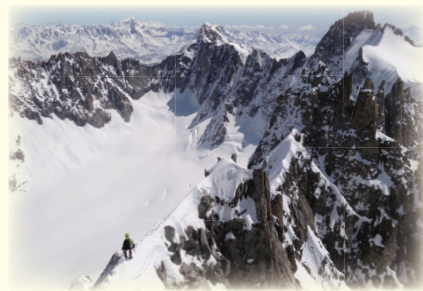
↑モンブラン山群（フランス） レ・クルト山頂付近にて