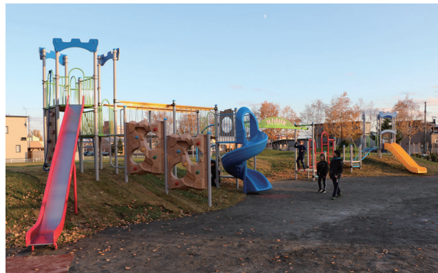
昨年設置されたライラック公園（西町）の遊具

新型コロナウイルス感染症対策のため、利用を延期または中止する場合があります。最新情報は電話でお問合せいただくか、町ホームページでご確認ください。