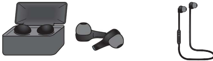
図1 完全ワイヤレスイヤホン（左）、左右一体型ワイヤレスイヤホン（右）

充電ケース 3 に入れて持ち運びながら充電し使用します。左右がケーブル等でつながった左右一体型ワイヤレスイヤホンは、充電ケーブルにてパソコンやコンセントにつないで充電を行います（図1）。