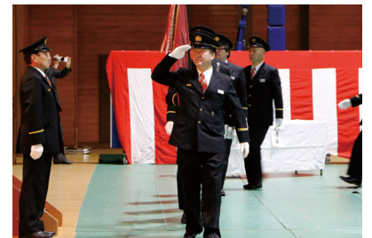
平成31年の出初式の様子