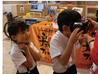
愛媛県宇和島市の販売ブース