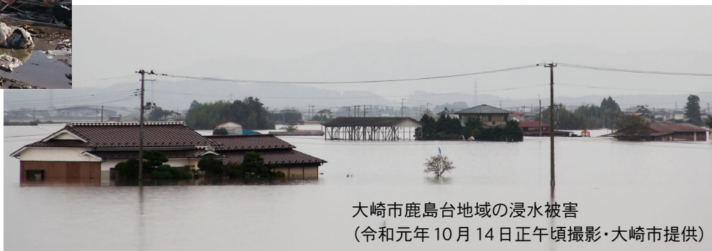
大崎市鹿島台地域の浸水被害 (令和元年 10 月 14 日正午頃撮影)