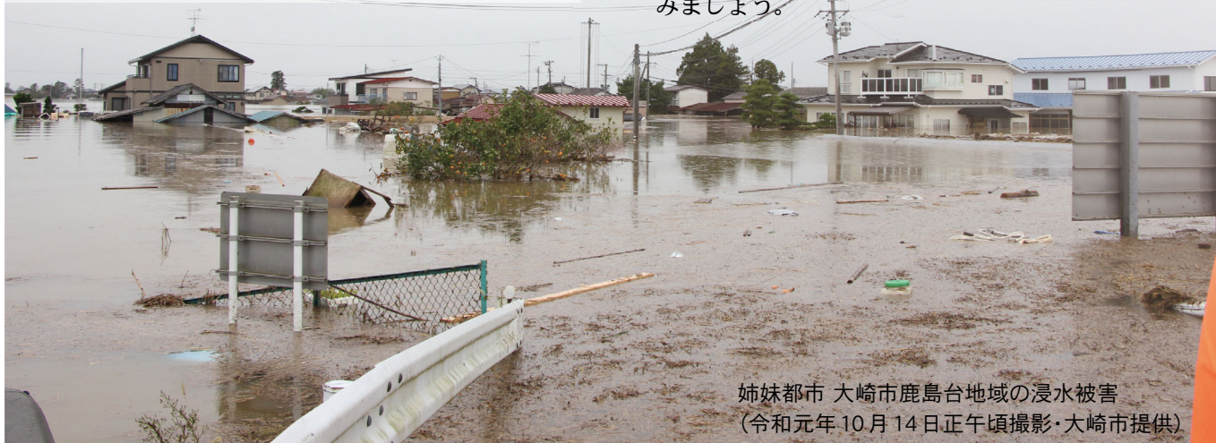
姉妹都市 大崎市鹿島台地域の浸水被害 (令和元年10月14日正午頃撮影)

昨年、当別町では、台風 21 号による強風の被害、胆振東部地震によるブラックアウトが発生し、今年には日本各地では台風が上陸するなど、自然災害による甚大な被害が日本各地で続いています。