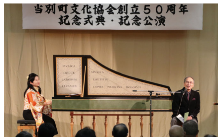
朗読音楽会（写真中央がチェンバロ）