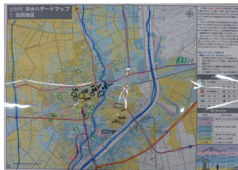
DIGで実際に書き込んだ地図