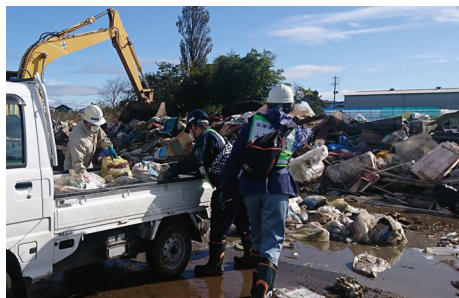
集積された災害ごみを トラックに積み込み作業 をする町職員

最も浸水被害の大きかった大崎市鹿島台地域では、10 月 13 日の未明に地域を流れる吉田川から越水したことにより、最大で 2.8 m 浸水するといった被害を受けました。鹿島台での避難者は最大 312 人、11 月 15 日時点で 35 世帯・84 人の住民が避難所で生活していたということです。