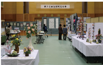
体育館を埋め尽くした展示作品