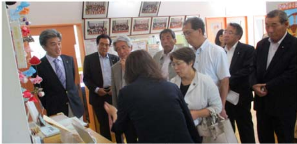
「認定こども園おとぎのくに」にて

今年4月より公私連携幼保連携型認定こども園となった社会福祉法人高陽福祉会が設置・運営する「認定こども園おとぎのくに」やふれあいバス西当別道の駅線、スウェーデン館を視察し、法人の方や担当課から説明がありました。