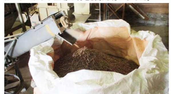
芽登ペレット工場で生産されたペレット

産業厚生常任委員会では、大樹町の町営住宅長寿命化計画と足寄町のバイオマス資源の有効活用について視察を行いました。足寄町では、ペレットボイラーやペレット工場の現地視察も行いました。