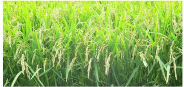
視察した水稻のほ場(蕨岱町)

リフォームが行われている東町団地や札沼線代替バスの予定路線で道路改良が行われる町道北八号線、水稻や大豆の生育状況を視察し、石狩農業改良普及センターの職員や担当課から説明がありました。