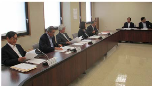
清水町議会での研修の様子

議会運営委員会では、議会改革や議会報告会の先進的な取り組みについて研修をするため、清水町議会と池田町議会へ視察に行ってきました。